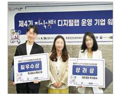
▲ 우수활동기업 포상 및 성과공유