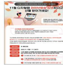
▲ 라이브방송 참여 후기 이벤트