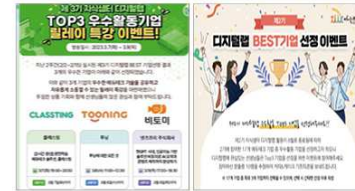
▲ 우수활동기업 선정 및 특강