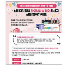
▲ 라이브방송 이수 이벤트