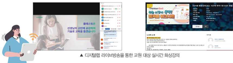
▲ 디지털랩 라이브방송을 통한 교원 대상 실시간 화상강의

· 라이브방송이란? 디지털랩 운영기업 에듀테크 제품(서비스)의 특징 및 사용 방법, 관련 첨단기술, 수업 활용 팁 등을 현장 교원에게 소개하고 자유롭게 소통할 수 있는 실시간 화상강의