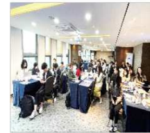
▲ 디지털랩 워크숍 개최