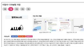
▲ "이달의 기업" 페이지를 통한 월단위 운영기업 홍보