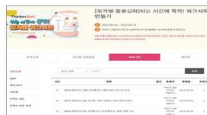
▲ 기업홈 내 커뮤니티 게시판