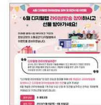
▲ 라이브방송 이수 이벤트