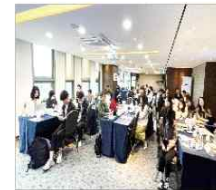
▲ 디지털랩 워크숍 개최