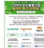
▲ 우수활동기업 선정 및 특강