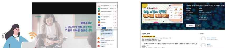
▲ 디지털랩 라이브방송을 통한 교원 대상 실시간 화상강의

• 라이브방송이란? 디지털랩 운영기업 에듀테크 제품(서비스)의 특징 및 사용 방법, 관련 첨단기술, 수업 활용 팁 등을 현장 교원에게 소개하고 자유롭게 소통할 수 있는 실시간 화상강의