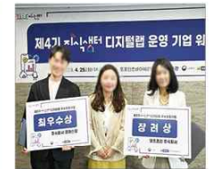
▲ 우수활동기업 포상 및 성과공유