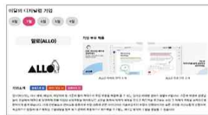
▲ '이달의 기업' 페이지를 통한 월단위 운영기업 홍보