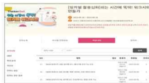
▲ 기업홈 내 커뮤니티 게시판