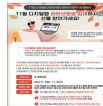
▲ 라이브방송 참여 후기 이벤트